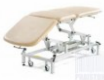
TAPICERKI STANDARD (W CENIE)