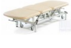
TAPICERKI STANDARD (ZA DOPŁATĄ)