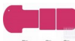
Blue Black Grey