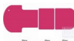
15cm 15cm 15cm