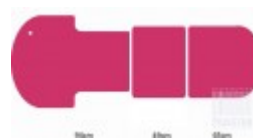
110cm 110cm 110cm