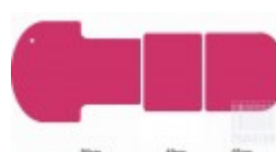
Blue Black Grey