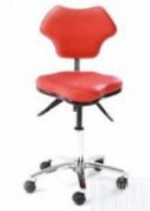
Model MC6158 Sonographers