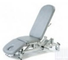
TAPICERKI STANDARD [W CENIE ]