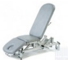
TAPICERKI STANDARD [W CENIE ]